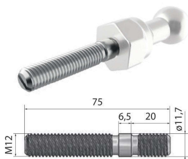
Adapter M 12

Adapter M 12 je kompatibilan sa 3 tipa gore navedenih zglobnih šipki za uzemljenje. Adapter je napravljen od čelika i pocinkovan.