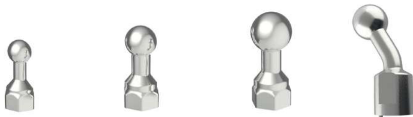
20 mm / M 12

Zglobne šipke za uzemljenje su napravljene za kratkospojnike i uzemljenje neaktivnih delova električne opreme. Ove zglobne šipke su napravljene od bakra i elektrolitički kalajisane. Proizvod je testiran i sertifikovan po standardu IEC / EN 61230 (5, 7).